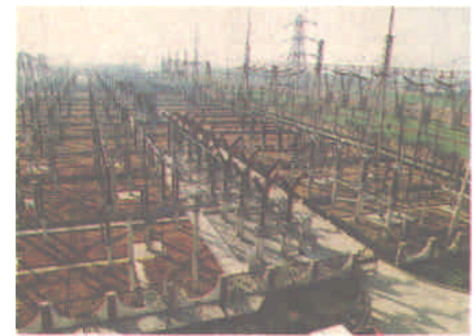
220KV杨家庄输变电工程