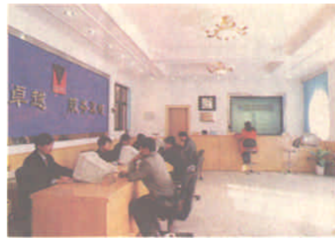
功能完善、服务设施齐全的营业大厅

局党委在实际工作中将思想政治工作和党的建设列入重要议事日程，成立了精神文明建设领导小组，设立了专门办公室，坚持每年年初制定精神文明建设计划，年中召开一次全局精神文明建设工作会议，每月检查精神文明月度计划完成情况。在做到“党委抓、行政抓、工会抓、团委抓”的前提下，实现思想政治管理工作的体系化、网络化，纵向到底，横向到边，从而形成了党委统一领导，党政共同负责，党政工团齐抓共管，以专职政工干部为骨干，以行政干部和工作骨干为主体，各部门各司其职，密切配合，职工群众广泛参与的“大政工”格局。为使思想政治工作落到实处，他们建立了“一岗两责”的工作机制及完善的考核管理