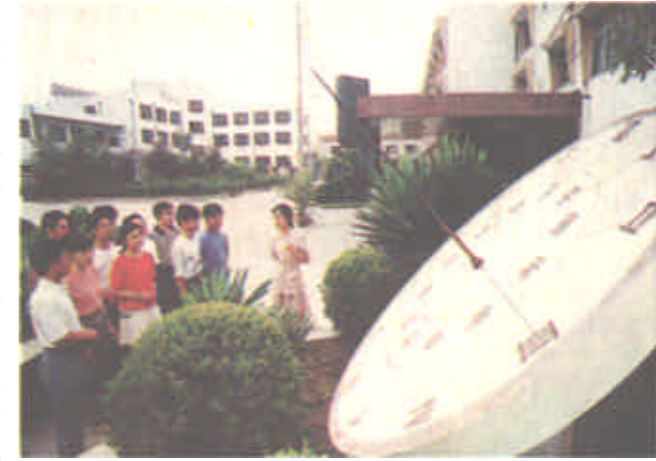
日暮前，意在引导职工珍惜时间、振兴东营电力的教育活动深入开展。

体系，明确规定：各级行政干部和骨干人员实行“一岗两责”从局长到科室室主任、公司经理、班组长，既是生产管理的