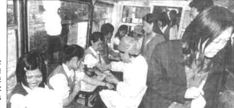
义务献血 奉献爱心

河口讯 近日，河口区国税局邀请30户企业和10个个体工商户的代表举行了“征纳换位恳谈会”。会上，双方开诚布公地进行了面对面交流，解答了有关疑问，此举增强了纳税人自觉宣传税法意识，提高了全局的征纳质量和执法服务水平。 (蔡继光 张建敏)