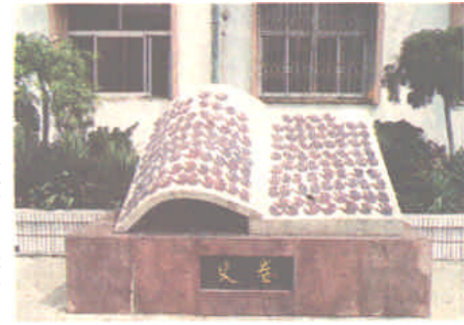
旨在教育职工用自己双手去创造东营电力美好明天的雕塑——史卷。