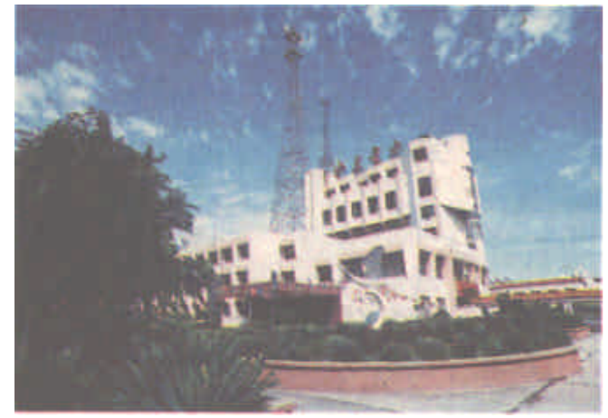
东营电业局调度楼一角