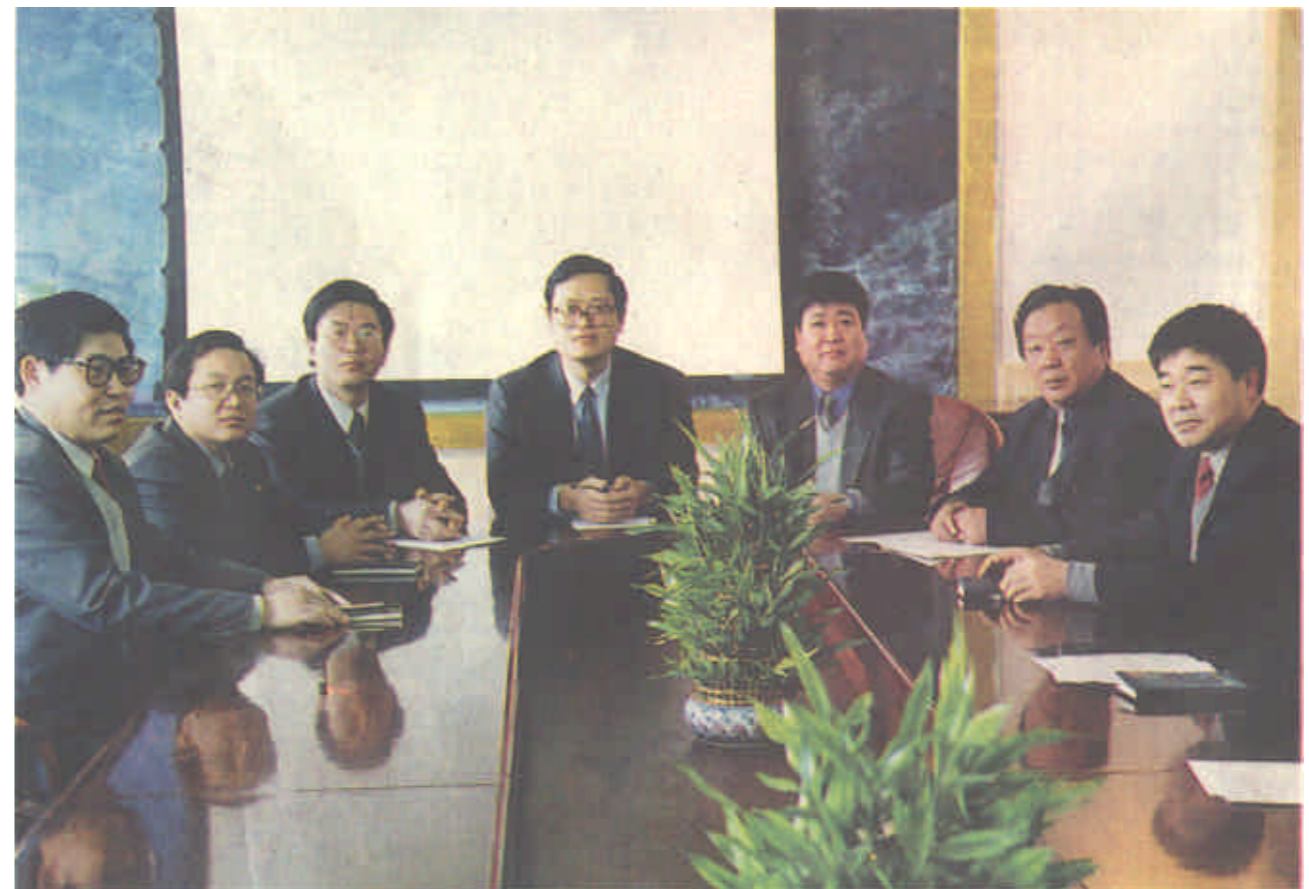
团结奋进的领导班子

“沧海横流，方显英雄本色。”充满生机的黄河三角洲哺育了年轻的东营电业。回首过去，东营电业局走过的是一条艰辛而辉煌的道路，展望未来，东营电力的前途光辉而灿烂。刚刚跨入新世纪的东电人正以饱满的热情、高昂的斗志，抓住全市“大开放、大招商、大发展”的良好机遇，当好经济建设的先行官，努力为黄河三角洲和胜利油田的开发建设做出更大的贡献。（尹德生 季永安）