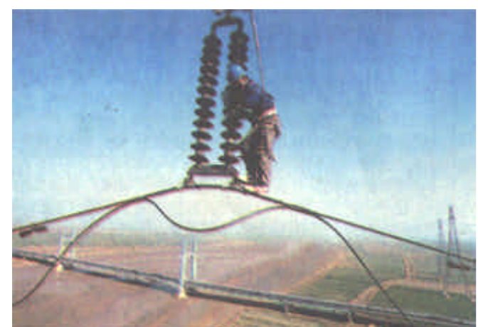
东营电业局职工登上黄河岸边高达85米的杆塔开展检修作业